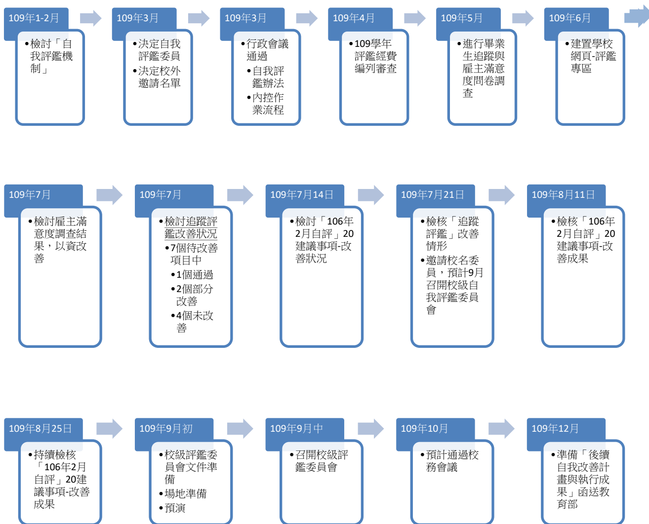
「109 年度自我改善計畫進度」流程圖